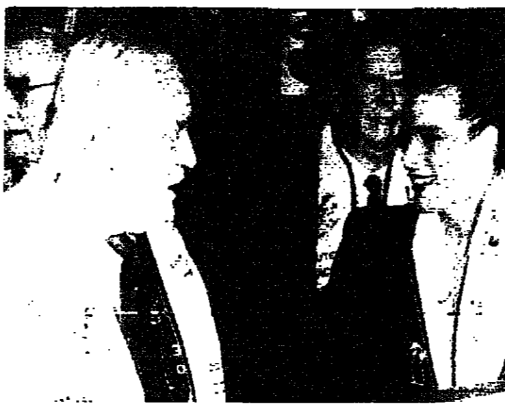
في الثاني من الشهر الجاري، افتتح في مونتكو السيرك الدولي الرابع عشر برعاية الأمير رينيه وحضور أفراد عائلة غريمبدي في الصورة الأولى: الأمير رينيه يتحدث إلى ابنته الأميرة ستيفاني